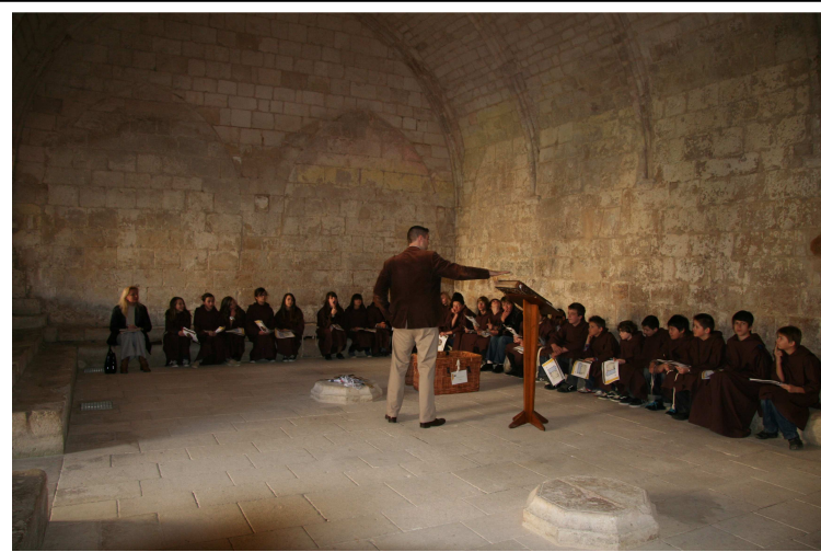
Dans la salle capitulaire