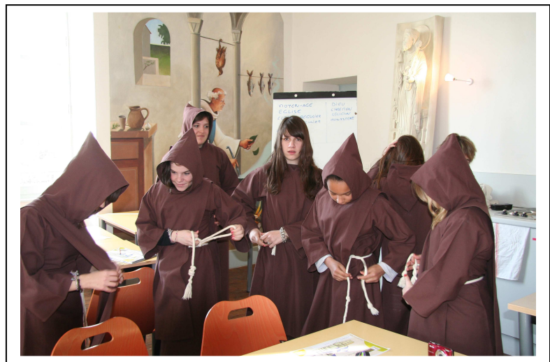
Allez, c'est fini...on rentre !