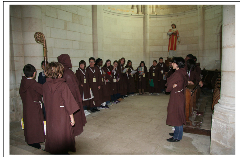
Dans le chœur, pour la prière