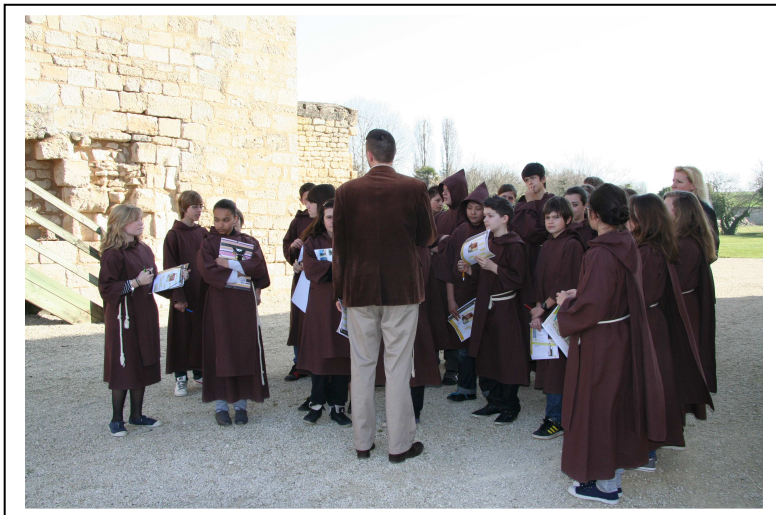
Visite...en habit de moine !