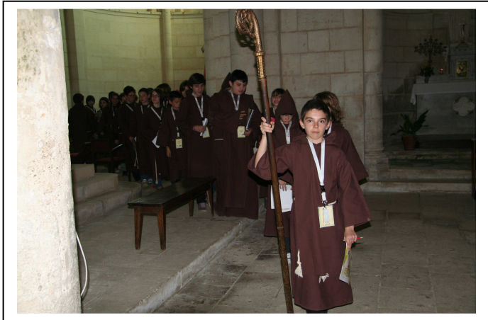
En procession, menés par l'abbé élu