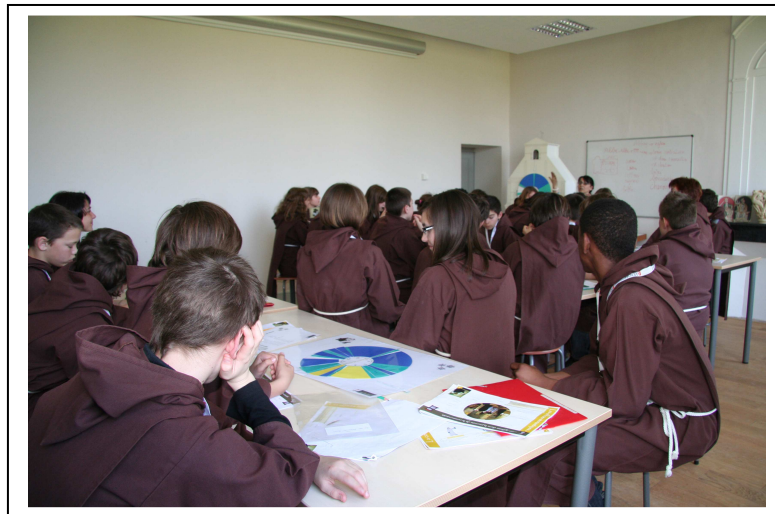
Travail sur l'emploi du temps d'un moine